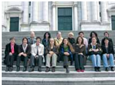
Rencontre des secrétariats Suisse alémanique

Après les échanges d'expériences et d'informations sociopolitiques, se sont les «relations humaines» qui se sont trouvées au centre des discussions, un thème très large traité dans le dossier 2008/2009: «Moi+Toi=Nous».