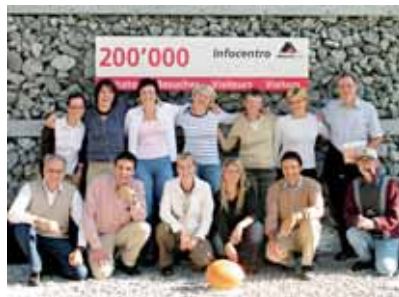
Rencontre des secrétariats Suisse romande et Tessin