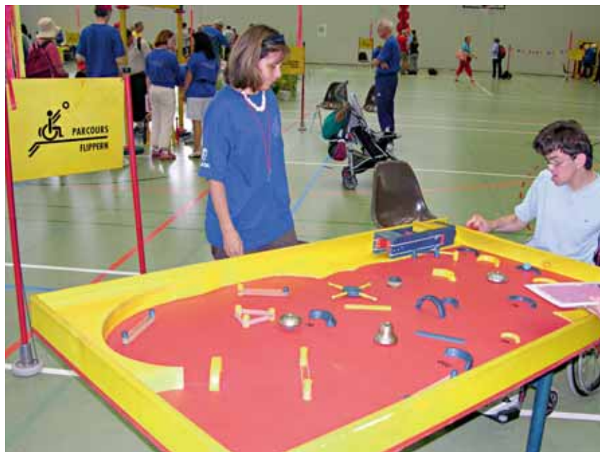
Journée PLUSPORT 2006

Les jeux choisis peuvent être empruntés pour plusieurs jours, excepté lors de la journée PlusSport qui se déroule chaque année à Macolin, (pour la 48 e fois le 5 juillet 2009).