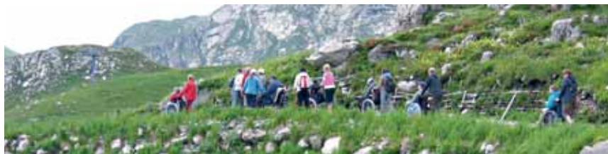
Vacances à Oberstdorf 2008

Le déficit en francs et en pourcent s'est révélé moins important que l'année dernière. Les coûts ne comprennent pas la préparation personnelle, le choix de la destination, la recherche des responsables et des assistant(e)s de vacances.